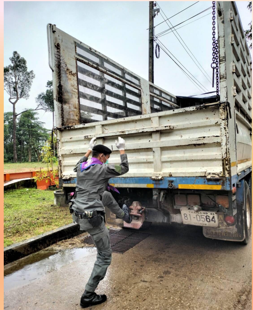
ร่วมตรวจเข้มรถบรรทุกทั้งขาเข้าและขาออก